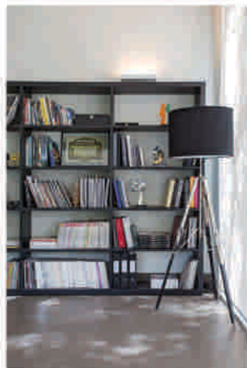
ACIMA Detalhes da sala do arquiteto.