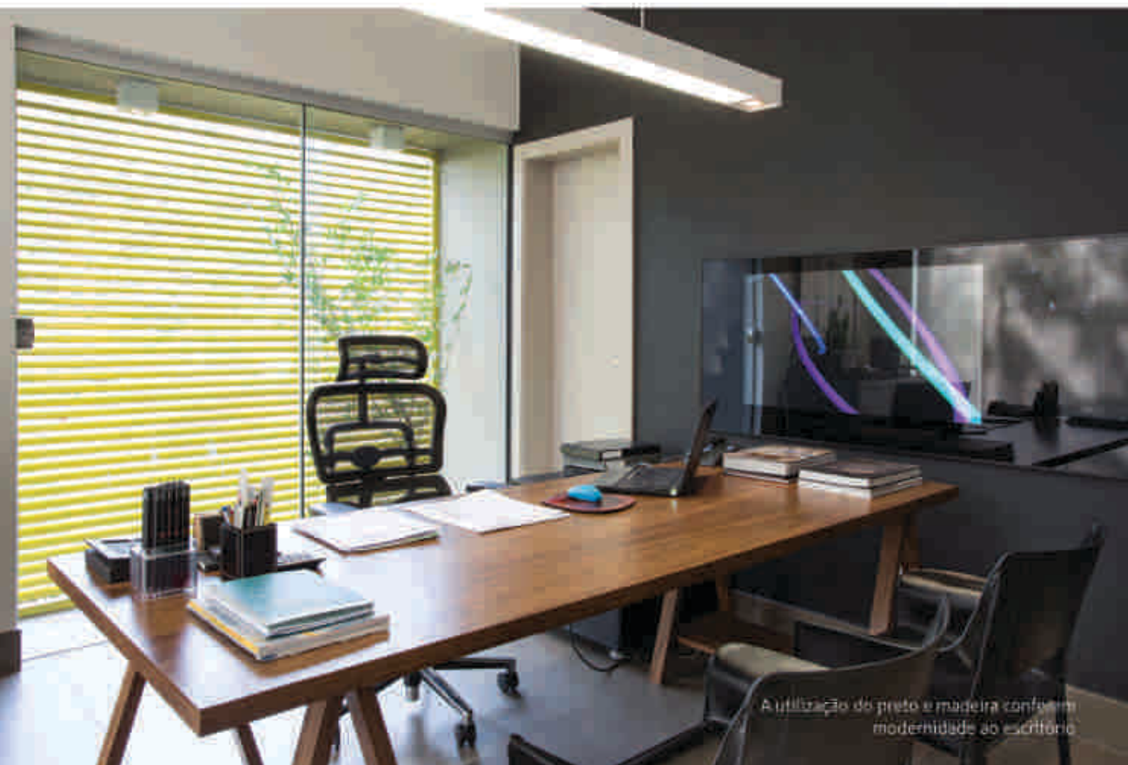
A utilização do preto e madeira confere modernidade ao escritório.

Uma grande vidraça frontal integra a árvore posicionada em frente ao terreno. Grandes janelas por toda o escritório minimizam o uso de iluminação artificial durante o dia. O balanço frontal de 5 metros oferece leveza à edificação, dando a impressão de flutuar. Para quebrar a monocromia da edificação, lateralmente, o projeto utiliza um volume com um brise em alumínio na cor amarela. A iluminação também foi bem estudada para o uso de cada ambiente além das iluminações de efeito. O novo escritório busca a identidade dos projetos do arquiteto, com seu traçado e ideologia. Ele procurou a integração de espaços, as transparências e jogo de volumes. No projeto foi utilizada internamente, a simplicidade nos materiais e no mobiliário.